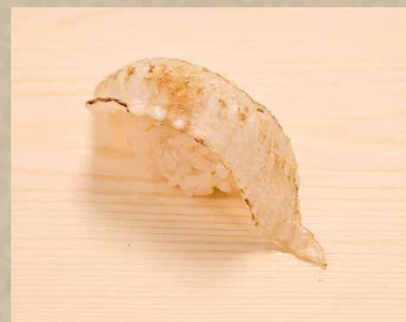
えんかわ 右口魚邊 Flounder Fin 40