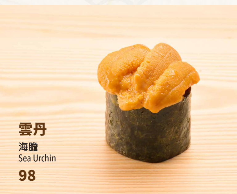
雲丹 海膽 Sea Urchin 98