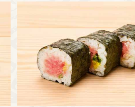
ネギトロ巻き 蔥吞拿魚卷 (3件) Minced Tuna Sushi Roll (3pcs) 68