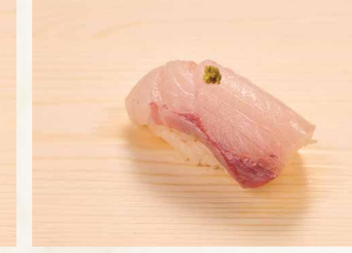
はまち・柚子コショウ 油甘魚・柚子胡椒 Japanese Amberjack · Yuzu Pepper 32