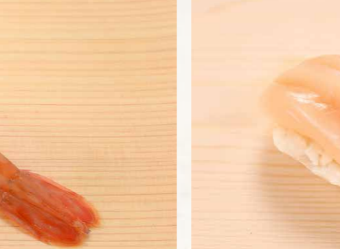
ホタテ貝 帆立貝 Scallop 40