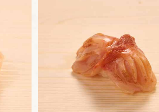
活け赤貝 活赤貝 Live Ark Shell 68