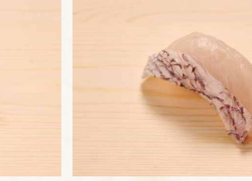
真鯛 真鯛 Seabream 40