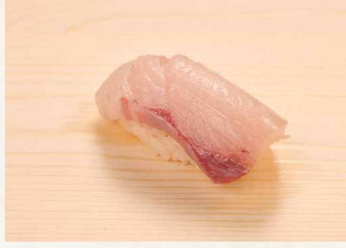
はまち 油甘魚 Japanese Amberjack 30