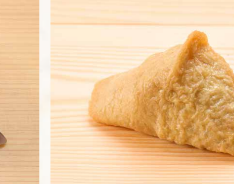
稲荷 腐皮 Sweet Beancurd 18