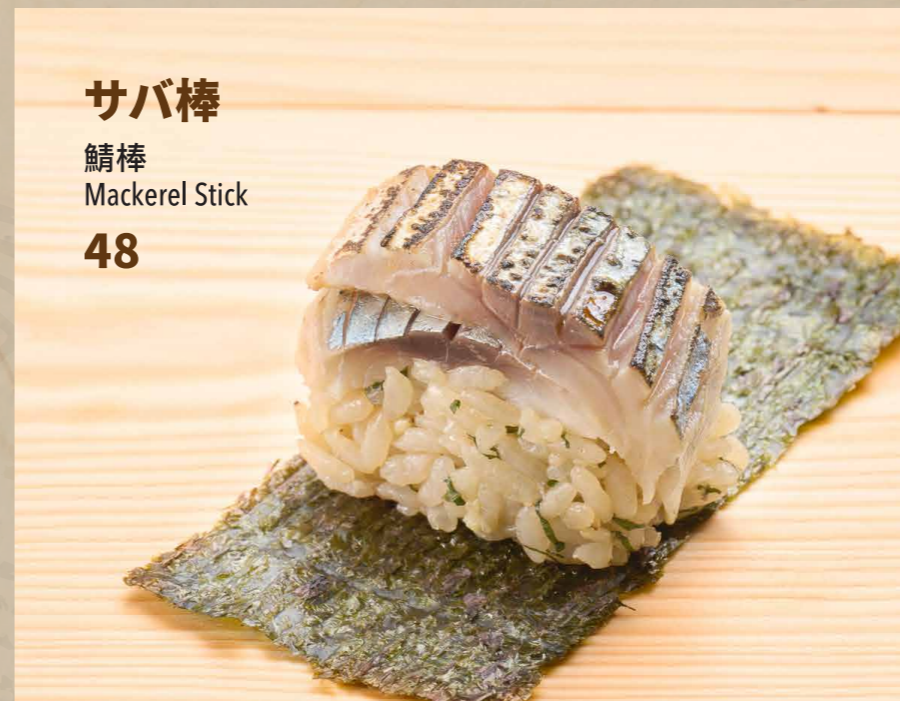
サバ棒 鯖棒 Mackerel Stick 48