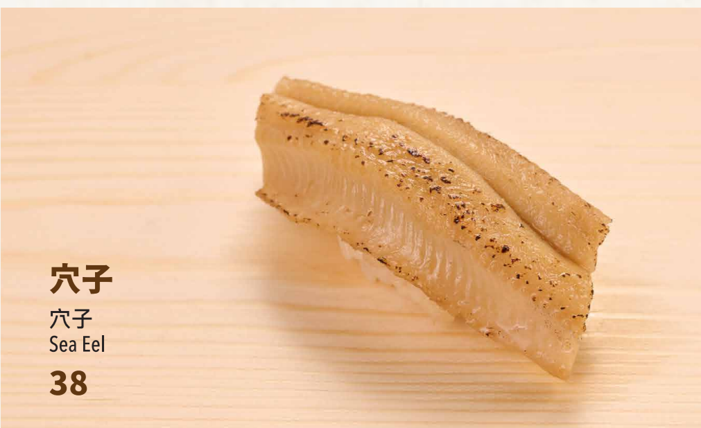
穴子 穴子 Sea Eel 38