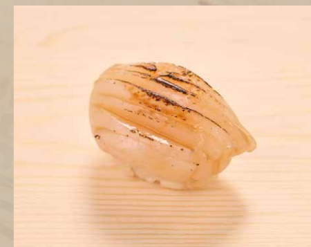
ホタテ貝醤油焼き 醬油帆立貝 Scallop with Soy Sauce 48