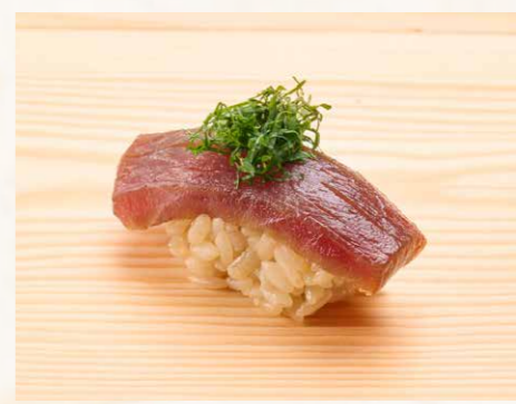
つけ鯖 醤油漬吞拿魚 Marinated Tuna 50