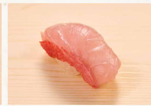
キンメ鯛 金目鯛 Golden Eye Snapper 68