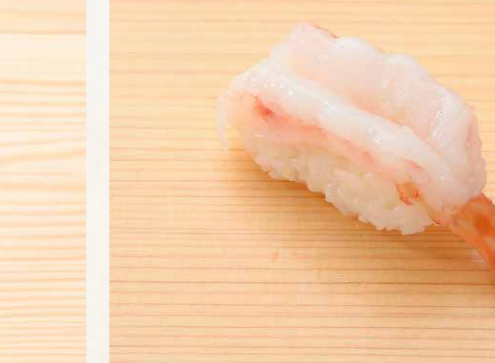
牡丹海老 牡丹蝦 Botan Shrimp 90