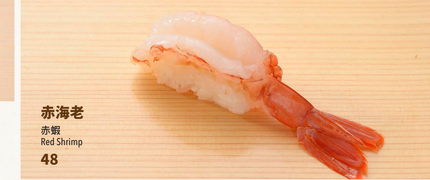
赤海老 赤蝦 Red Shrimp 48