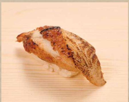
うなぎ 鰻魚 Eel 28