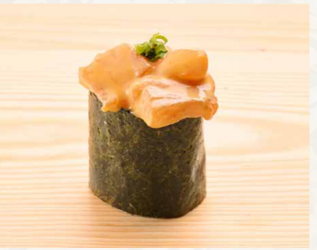
スパイシーサーモン 辣味三文魚 Spicy Salmon 20