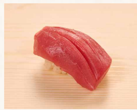
まぐろ 吞拿魚 Tuna 48