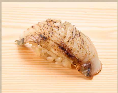
シマアジ 深海池魚 Striped Jack 48