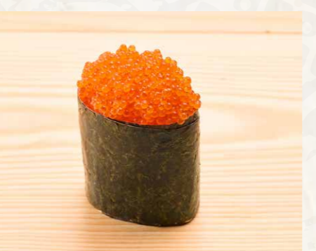
とびっこ 蟹籽 Crab Roe 28