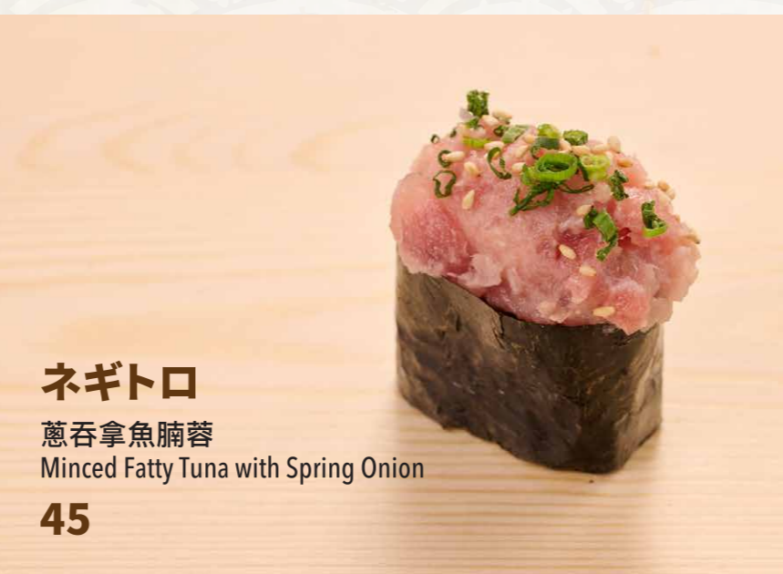
ネギトロ 蔥吞拿魚腩蓉 Minced Fatty Tuna with Spring Onion 45