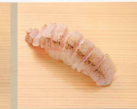
トロ 大吞拿魚腩 Prime Fatty Tuna 85