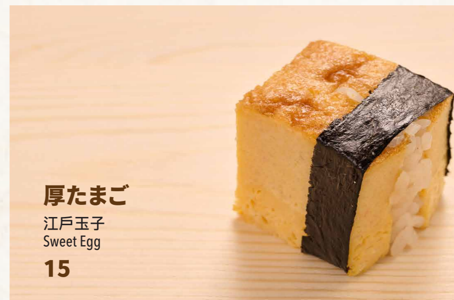
厚たまご 江戸玉子 Sweet Egg 15