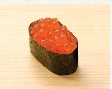
いくら 三文魚籽 Salmon Roe 68