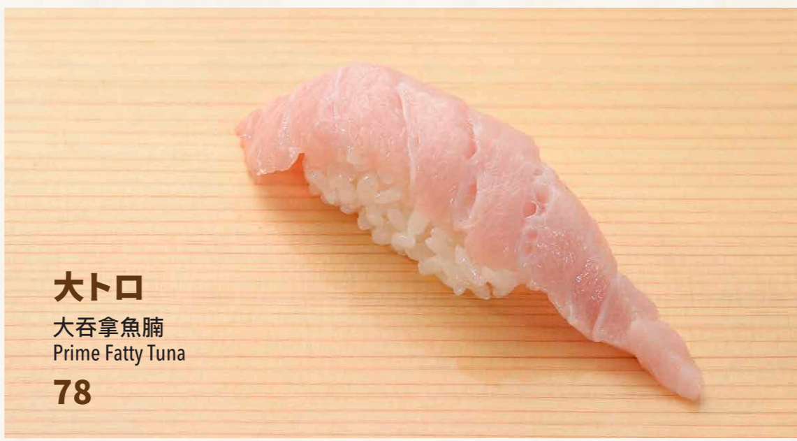
大トロ 大吞拿魚腩 Prime Fatty Tuna 78