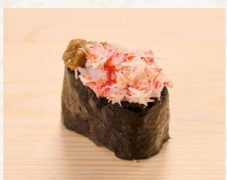
蟹みそ 蟹肉蟹膏 Crab Meat with Crab Paste 38