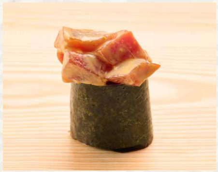
ピリ辛マグロ 辣味吞拿魚 Spicy Tuna 48