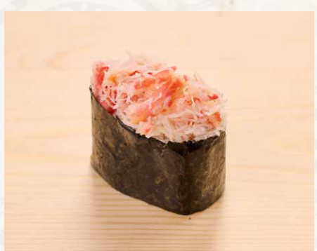
蟹肉 蟹肉 Crab Meat 48