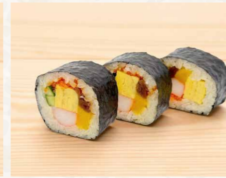
太巻き 太卷 (3件) Thick Sushi Roll (3pcs) 78