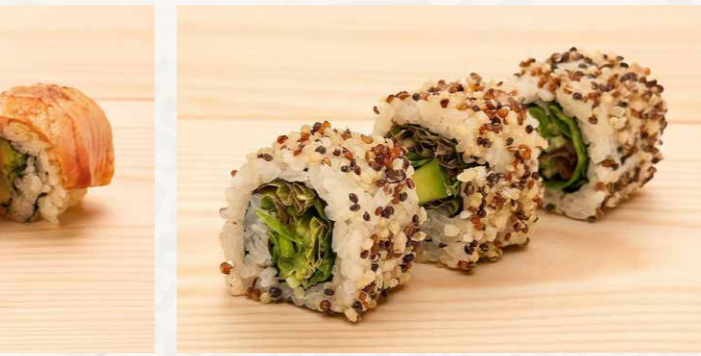
キノア野菜ロール 藜麥野菜卷 (3件) Quinoa Vegetable Roll (3pcs) 58