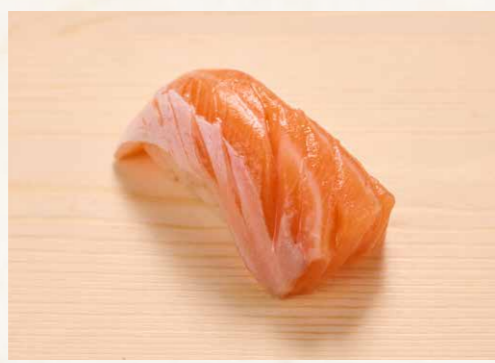
トロサーモン 三文魚腩 Prime Salmon 25