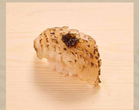
えんかわ醤油焼 右口魚邊・醤油 Flounder Fin · Soy Sauce 42