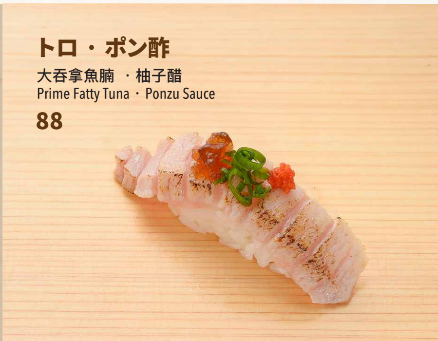
トロ・ポン酢 大吞拿魚腩・柚子醋 Prime Fatty Tuna · Ponzu Sauce 88