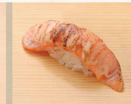
鮭 三文魚 Salmon 20