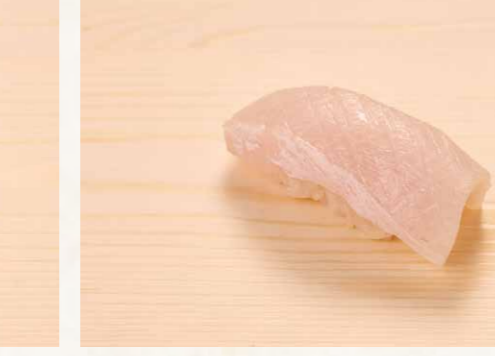
はまち腹 油甘魚腩 Prime Japanese Amberjack 48