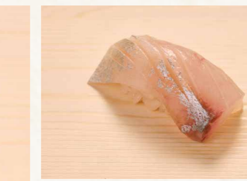
シマアジ 深海池魚 Striped Jack 42