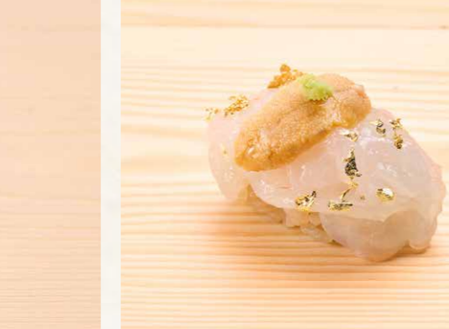
白エビ雲丹 白蝦海膽 White Shrimp with Sea Urchin 90