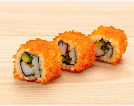
カリフォルニアロール 加州卷 (3件) California Roll (3pcs) 58