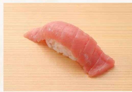
中トロ 中吞拿魚腩 Semi-fatty Tuna 68