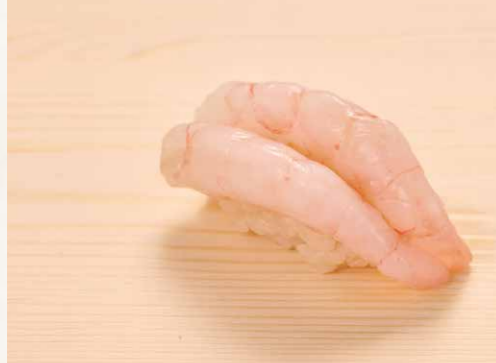
甘エビ 甜蝦 Sweet Shrimp 48