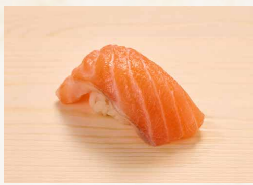
サーモン 三文魚 Salmon 18