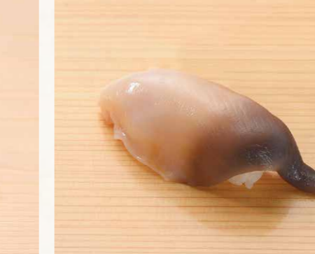
活けホッキ貝 活北寄貝 Live Surf Clam 58