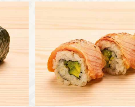
アボカドサーモン巻き 牛油果三文魚卷 (3件) Avocado Salmon Sushi Roll (3pcs) 68