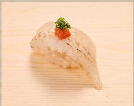
えんかわ・ポン酢 右口魚邊・柚子醋 Flounder Fin · Ponzu Sauce 42