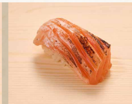
鮭はら 三文魚腩 Prime Salmon 28